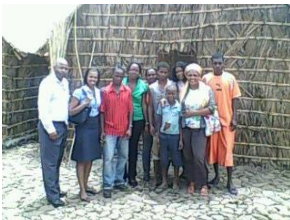
Foto: Visita Comunidade dos Rabelados