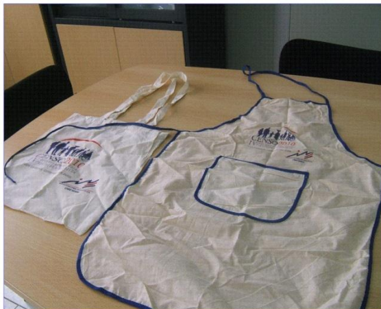
Saco de Praia e Avental