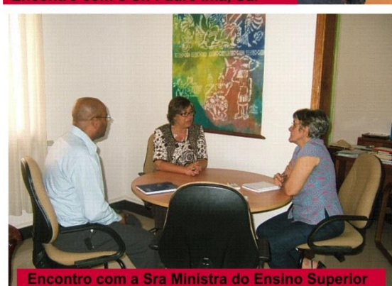
Encontro com a Sra Ministra do Ensino Superior