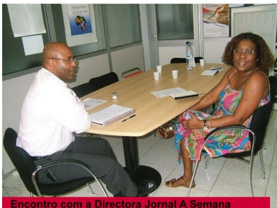
Encontro com a Directora Jornal A Semana