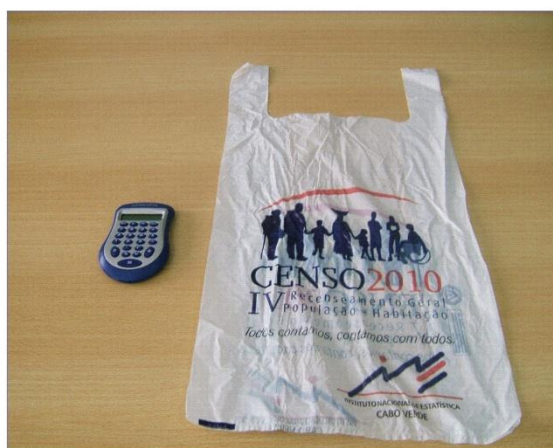
Saco de Plástico e Calculadora