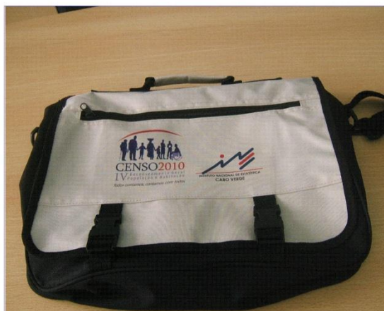
Bolsa de Nailon