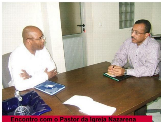
Encontro com o Pastor da Igreja Nazarena