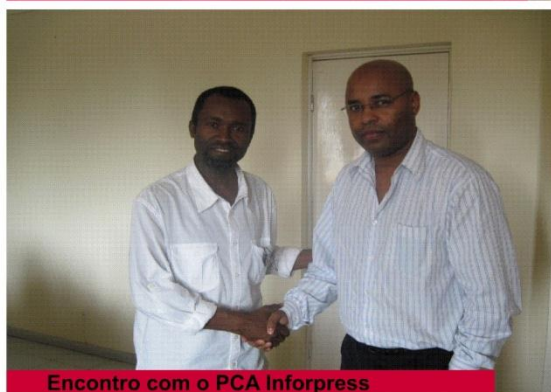
Encontro com o PCA Inforpress