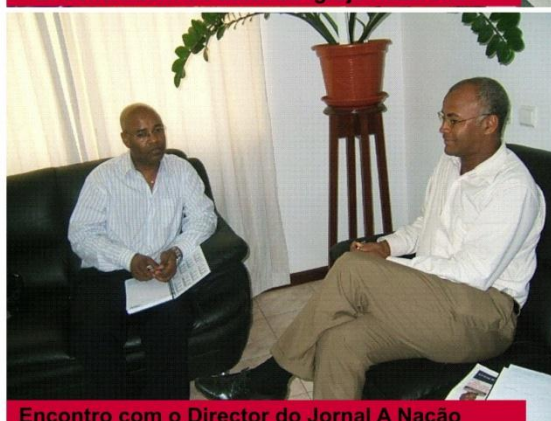
Encontro com o Director do Jornal A Nação