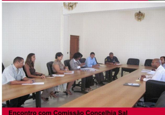
Encontro com Comissão Concelhia Sal