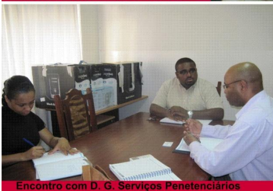
Encontro com D. G. Serviços Penetenciários