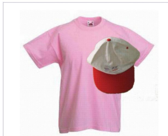
Camisola e Boné