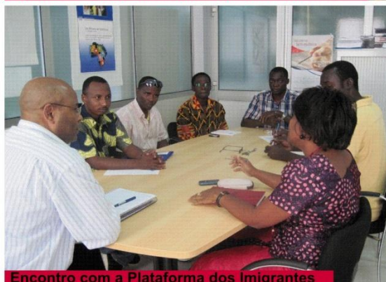
Encontro com a Plataforma dos Imigrantes