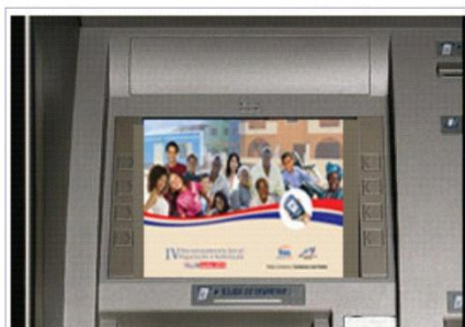
Publicidade na Rede Vintí4