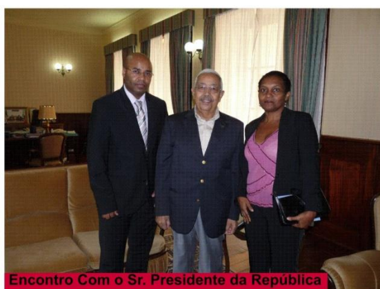
Encontro Com o Sr. Presidente da República