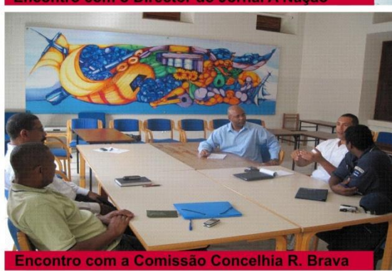
Encontro com a Comissão Concelhia R. Brava