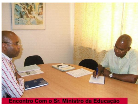
Encontro Com o Sr. Ministro da Educação