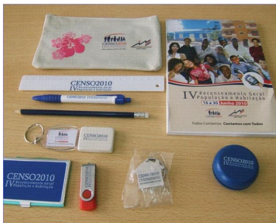
Estojo, régua, lapis, caneta, porta cartões, pen drive, yoyo, borracha, bloco de notas e chaveiros