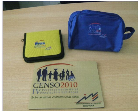
Tapete de rato, saco de toalete e porta CD