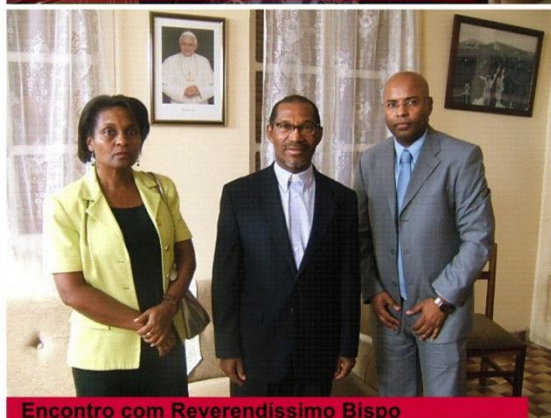
Encontro com Reverendíssimo Bispo