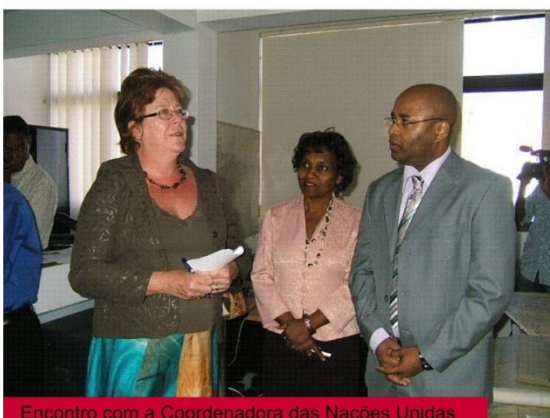
Encontro com a Coordenadora das Nações Unidas