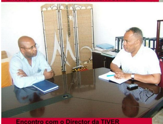
Encontro com o Director da TIVER