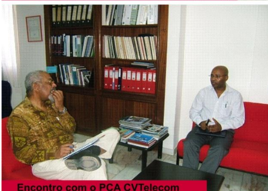
Encontro com o PCA CVTelecom