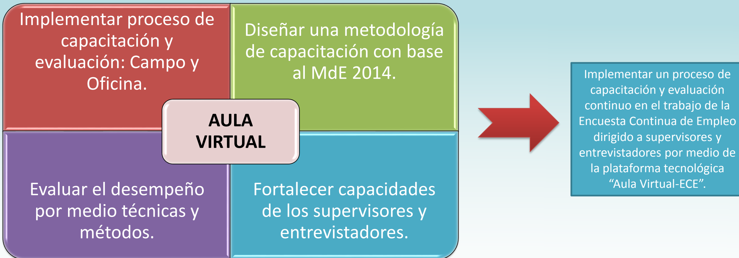
Diagrama 1. Objetivos específicos y general de la propuesta Aula Virtual.